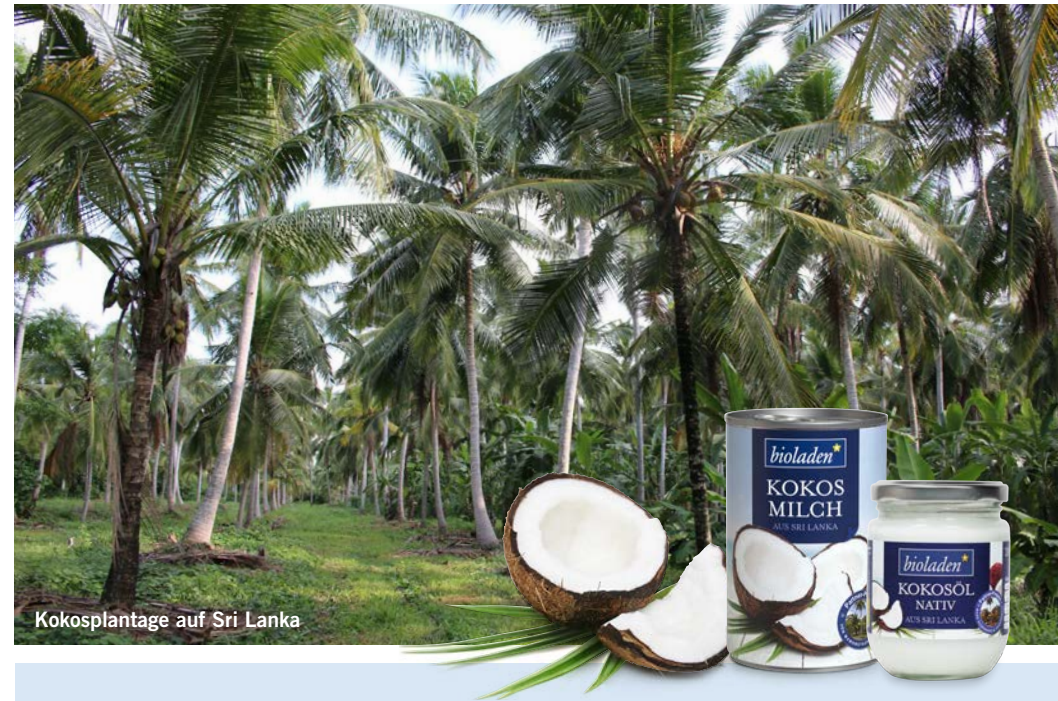
Kokosplantage auf Sri Lanka

Die bioladen*Kokosprodukte stammen aus einem der bioladen*Partner-Projekte auf Sri Lanka.